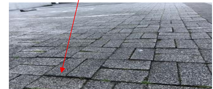
石畳のデコボコに 躓き転んで怪我を されました。